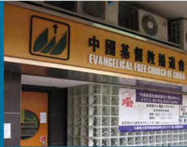
和平樓自修中心 (前身和平堂自修中心)