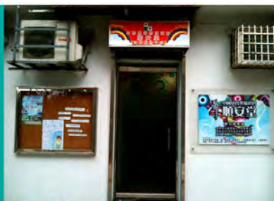
順安堂社會服務中心