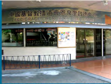
1986 恩泉堂啟德中心 (前身恩泉自修室)