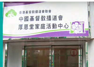
厚恩堂家庭活動中心