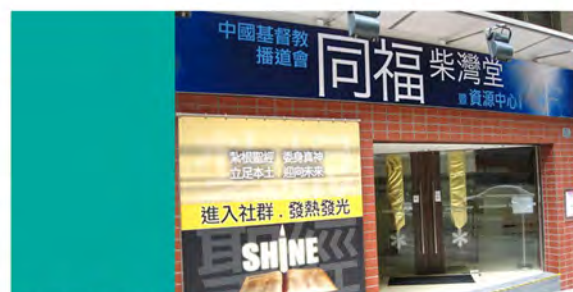
2009 同福資源中心 (港島東)