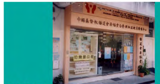
1995 康福堂白普理社區健康發展中心