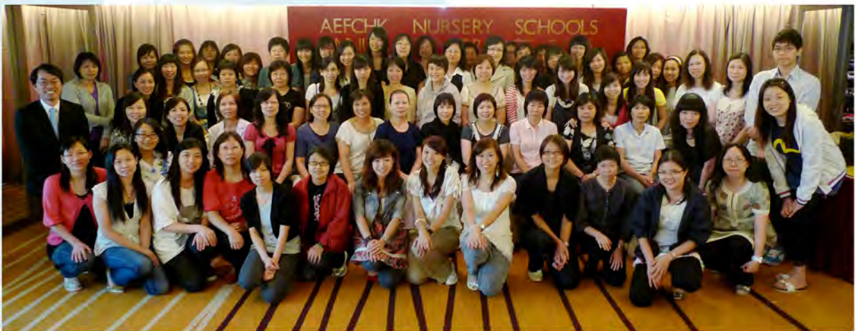
幼兒學校全體教職員