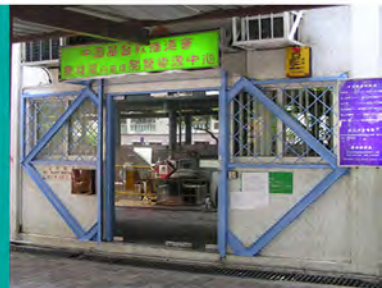
1993 景福白普理閱覽資源中心