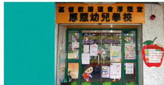
1994 厚恩堂厚恩幼兒學校