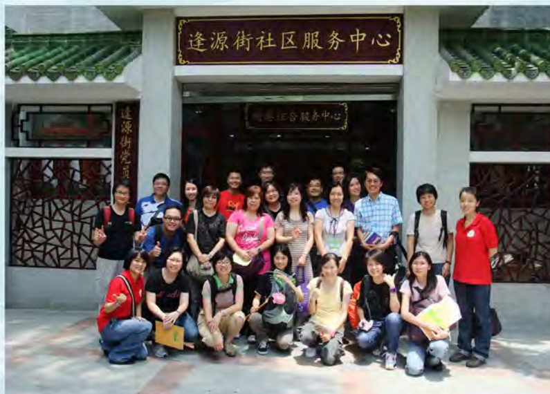
2010年7月30日長者中心職員在廣州交流日合照