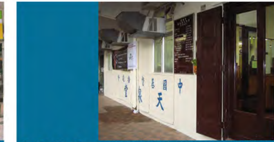
1988 天泉青少年空間 (前身天泉堂自修室) 興田邨道真堂愛禮信長者中心