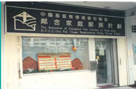
1992 彩福堂鄰舍家庭服務中心