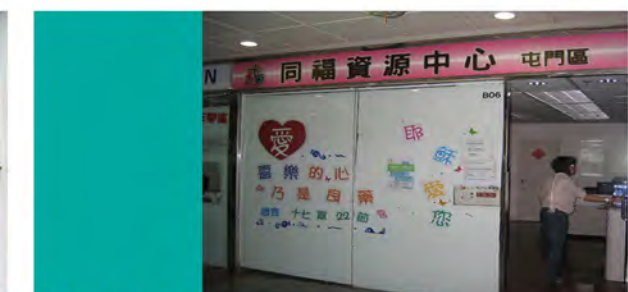
2008 同福資源中心 (屯門區)