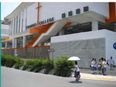
2006 播道書院 (直接資助一條龍中小學)