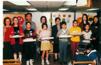
部份會員領取證書後與導師合照