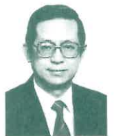
楊伯倫（香港資深聖樂作曲家）

奚秀蘭姊妹告訴我，她曾參加一個大型綜合性佈道會，負責選曲的弟兄要選用一首過去的流行時代歌曲：「如果沒有你」和幾首同類型的歌曲來填詞，作為佈道會的演唱，奚秀蘭和藝人之家的成員都反對，不肯使用。她說：「選曲總要有些分寸，有個底線吧！」她並表示：「做個信主的藝人真不容易，很多時候自己要做適當的抉擇，不能在世人面前失去見證！」我很同意和同情她的意見。現在是二千年新世紀、新時代，一切事物發展快得讓人喘不過氣，不跟上時代嗎？不可能；若一直走到時代的前端，又會失去了自我。尤其是信主的人，又想堅持真道，提升靈命；又要面對一切的新事物，令人眼花撩亂，無所適從。在這忙亂的時刻裏，沒有一安靜的時刻，很難像《路加福音》十章裏馬大的妹子馬利亞般，能坐在耶穌腳前聽祂講道，多了解神的心意，討祂的喜悅，榮耀祂的名，見證祂奇妙的作為。美國的教會已漸趨沒落，王永信牧師也曾大聲疾呼地說：「如果我們再死跟着西方沒落的文化，基督教總有一天要沒落了。」聽聞此語，叫人能不心驚嗎？