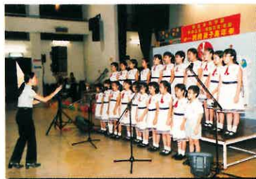
方方樂趣兒童合唱團獻唱