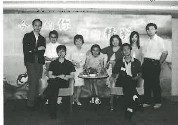
大會籌委及部份工作人員