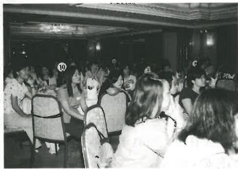
各參加者全神貫注聆聽講員分享

誠然，上述所說的，似乎是一幅美麗的圖畫，鼓勵我們可以繼續去享受或活出單身的精采生活。但在最後階段的答問時間，一位姊妹帶出了一個頗實在的問題：有一位年過四十歲的單身姊妹，我們應如何去幫助她求偶及面對失業的困境？而自己最近也遇到幾位單身的弟兄姊妹，他們在個人的成長方面較為複雜，而同樣飽受着精神與失業的問題作為主內的肢體，我可以有何回應呢？在近日靈修時領受的一節經文，盼望藉此機會與眾分享：「身上肢體，我們看為不體面的，越發給他加上體面，不俊美的，越發得着俊美。我們俊美的肢體，自然用不着裝飾，但神配搭這身子，把加倍的體面給那有缺欠的肢體，免得身上分門別類，總要肢體彼此相顧。」（林前十二23-25），願共勉之。✎