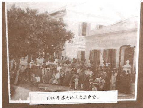
1906年落成的「志道會堂」