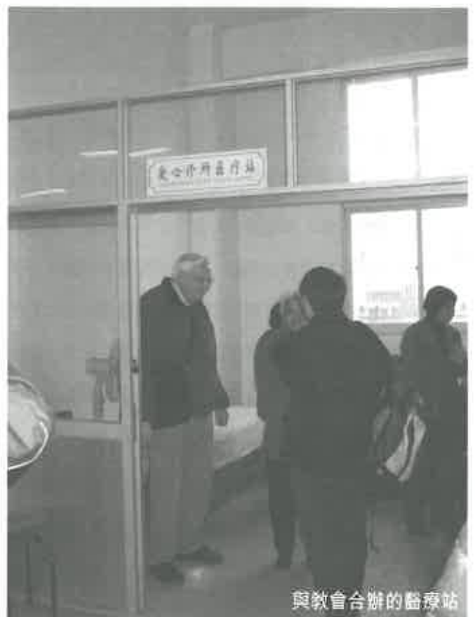
與教會合辦的醫療站