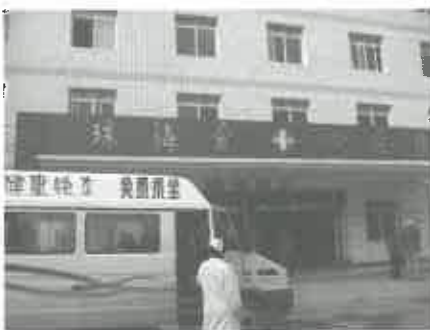
醫療車為偏遠地區居民診治

這些醫療服務實在為當地居民提供了很多的幫助，診所為居民提供便宜及專業的醫療服務；而流動醫療車每月輪流到不同山