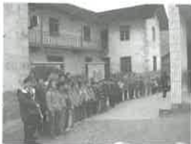
受資助學生歡送探訪隊

當醫療關懷開始為雲龍山區農民提供援助時，大部份農民對種植新品種的茶葉均存懷疑態度，只有一位村長勇敢地接受挑戰，將農田改種茶葉。一棵茶樹有幾十年的收成回報，種茶每年的收入不斷增長，至第六年及後，每年每畝約有2500元的穩定收入，比起過去每年約300至400元的收入，農民的生活肯定得到改善。現時該村已有80戶接受共100畝的資助，醫療關懷只是最初資助農民購買優質茶苗，並由鎮政府提供培訓，教導農民種植茶葉，日後的收成就靠農民自己的努力。