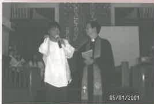
文浩受洗時見證分享