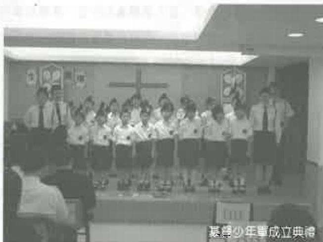
基督少年軍成立典禮

導師們確實明白到自己也會有不足之處，未能完全吸引到隊員的注意力，但是，我們也沒有想過要放棄任何一個隊員。縱然，有隊員要離開，我們也會想盡辦法吸引他們回來，繼續緊守不離不棄的信念，為要建立每一個隊員，能夠成為耶穌基督的精兵。✎