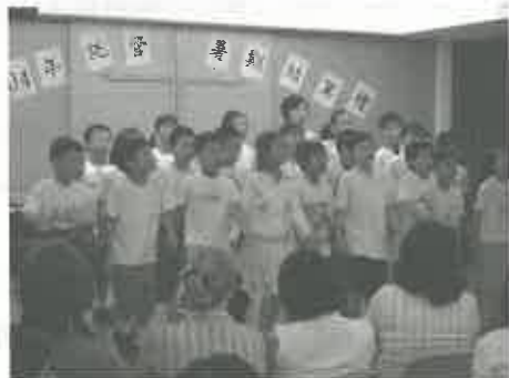
暑期託管畢業典禮

透過每天接觸及每星期一次的聖經小組，我們與孩子們分享福音及禱告，不少孩子的改變足以見證主的作為，而且孩子的家長也深被感動。此外，我們也有機會認識不少單親家長，叫我更明白神的慈愛可以彰顯在這些不幸的家庭中。當想到孩子在這兒逐漸成長及認識神，而他們的家長也可安心在外工作，這就是對我最大的回報。✪