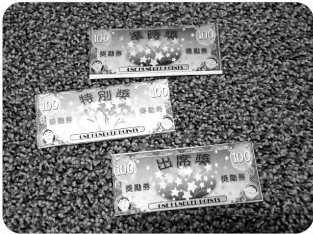
兒童崇拜設有不同的獎勵，讓小朋友更投入每一次的聚會。

教導孩子絕非容易的工作，但卻是十分寶貴的投資。看到同福堂的孩子，不單在崇拜裡經歷敬拜和學習神話語的喜樂，更有機會透過事奉去裝備自己，將所學習的實踐出來，體驗為神工作的意義。盼望神繼續使用導師，也使用孩子，建立祂的國度。