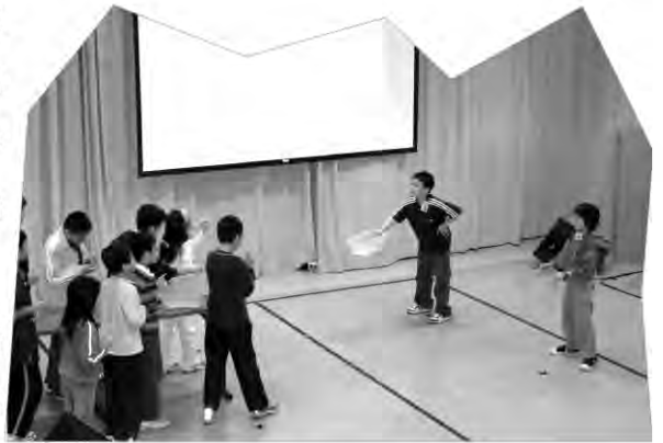
小朋友和導師都投入在遊戲當中，積極參與。

兒童崇拜在一片歡呼聲中開始了。小朋友們按座位編成兩大組，首先進行一輪競技比賽。在導師們活潑的帶動下，除了被派出賽的小朋友外，其他組員都一同吶喊助威，為自己的隊友打氣。如此，參賽的與打氣的互相呼應，令會場的氣氛達至沸騰。