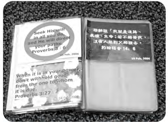
精美的金句簿，珍藏着神的話語，當然，更重要的是將它們藏在心中！