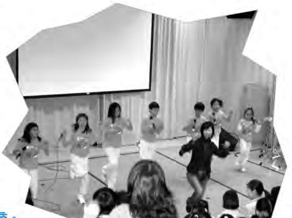
小小的敬拜隊，隊型整齊，帶領大家敬拜上帝。

崇拜完結後，筆者與幾位敬拜隊隊員談話，他們同時也是兒童佈道隊的成員。除了週末崇拜前的綵排練習，週日的晚上，他們也會到教會接受「培訓」。當中有不少表演技能如歌唱、舞蹈及戲劇等排練，亦有佈道工具和使用技巧的訓練。更重要的，就