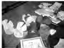
點解好似咁難：五種顏色的魔術福音花

雷先生強調，要有好的表現，沒有一蹴而就的，必須花時間和心機去練習。起初的時候，大家都顯得生硬，雞手鴨腳，還經常有「穿繃」和「食螺絲」的現象，引得大家捧腹大笑。但經過幾星期的努力，大家明顯地有了些進步。甚麼「巧變銀錢」、「剪