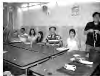
開始啦！準備好未呀？

相信再假以時日，每個學員都能手到拿來，揮灑自如地講述福音，表演故事了。屆時，無論是主日學、兒童崇拜的講故事；或兒童佈道會的福音信息、個人佈道；或是社區嘉年華會的攤位遊戲等，這些「絕技」都能大派用場了！