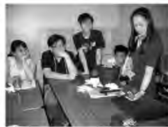
大家唔好眨眼，我要變……