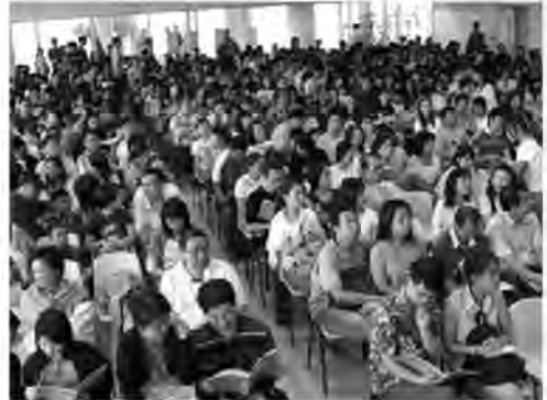
簡介會：第一次於播道書院內舉行小一招生簡介會，場面鼎盛。