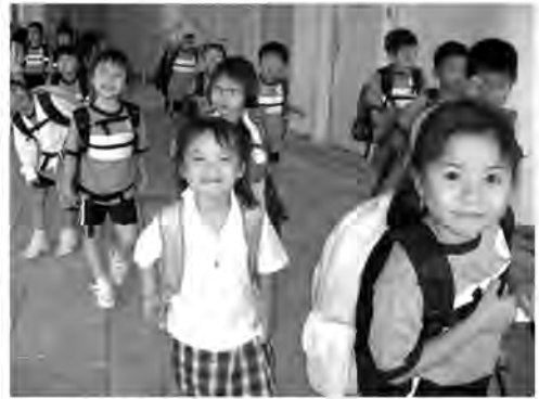
學生快快樂樂上學去。