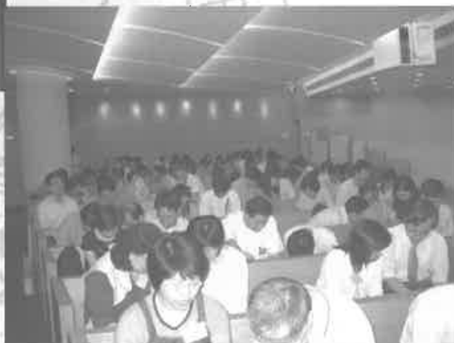
開會前先有小組祈禱