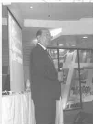
鮑會園牧師為新一屆執行委員勉勵及祝福