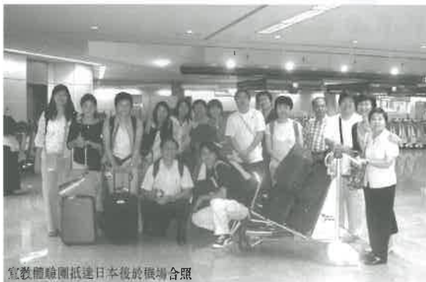
宣教體驗團抵達日本後於機場合照

日本人雖然相信有很多神，但現代的日本人已經轉變了，他們所相信的不再是那些神了，而是他們自己！日本人對他們自己國家的歷史、文化、傳統認識很深，歸屬感很強，從而使他們覺得自己很強，男人的自尊