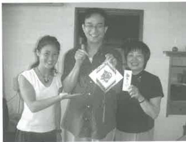
作者與日本播道會會友合照

程的認識很少，但看到各教會都有推動佈道的工作，在暑假舉辦夏令營、英文營、佈道會，他們對福音佈道的熱誠，令我甚為欽佩。日本教會群體雖少，但五臟俱全，加上聖靈的同在及工作，教會便會增長。願神祝福日本的事工，使更多人認識神的福音，信徒增加，建立教會。