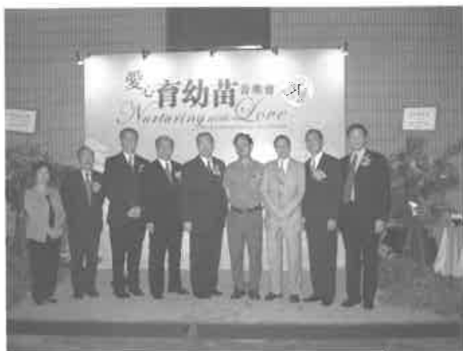
辦學籌委及工作人員合照