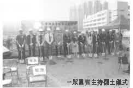
—眾真真主持翻土儀式

上與則師們細心研究修改，為同學提供一美輪美奐的校舍，優美翠綠，具有環保意念的學習環境，充足學習和活動空間，讓同學們愉快學習，健康成長，我們亦頗重視建立良好的師生關係，家校合作，積極友愛，關懷校園文化。