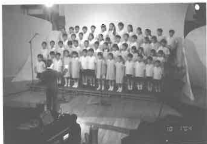
國際基督教優質音樂中學暨小學合唱團