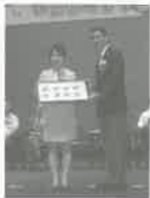
總會主席代表致送紀念品