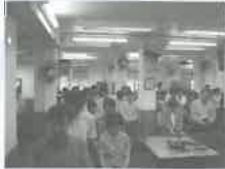
約有105名會友出席「播道學校福音夥伴」異象分享會，聚會之先，同心為辦學事工禱告。

今年首個八號風球過去後，接續是一個風和日麗的星期天，當日(7月27日)舉行了「播道學校福音夥伴」異象分享會。感謝主！在那天，「福音事工小組」向出席堂會分享了本會所認定的異象及方向，更寶貴的是聽到堂會的聲音和意見。