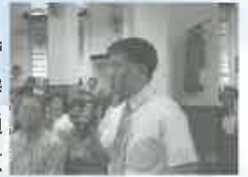
各堂會代表踴躍發表意見及提問。